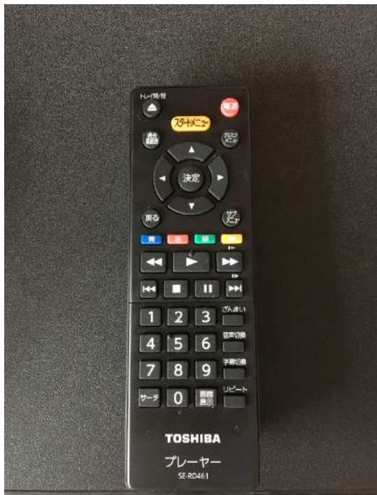
ブルーレイデッキ